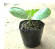
【カボチャの発芽 作業】