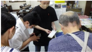
【昼食の会計は自分で】

長瀬元気プラザについては、カレー炊飯をしました。事前のカレー炊飯が生かされ、とてもおいしくできました。