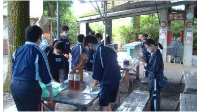
【みんなでカレー作り】