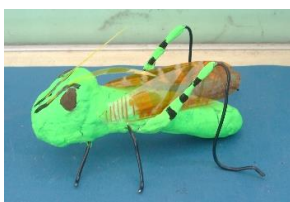
【大好きなバタを作りました。美術】

1学期は、美術、家庭科、作業でたくさんの作品を作りました。どれも丁寧に作られていますね。