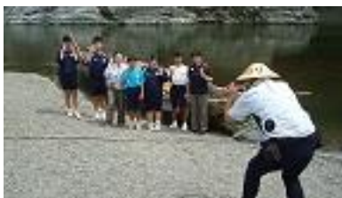
【ライン下りのあとに】

2日目は、長瀬ライン下り、長瀬神社参拝、県立自然の博物館見学と、大変忙しく歩き回りました。そんな中でも、ライン下りは、とても楽しく、素晴らしい経験となりました。