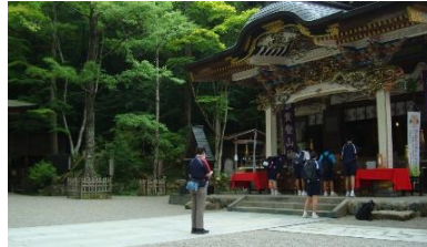
【長瀬神社にお参り】