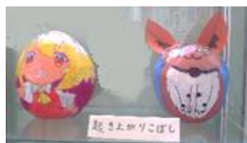
【起き上がりこぼしを作りました。美術】