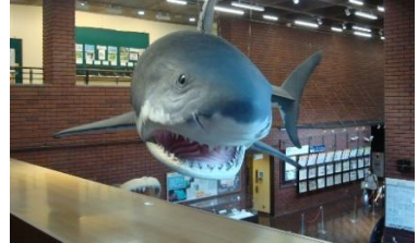
【メガロドンをご対面！！】

そして最終日、絞り染め体験をしたあと、元気プラザで昼食をとり、帰途につきました。中身の濃い3日間を過ごし、生徒も少したくましくなった気がします。