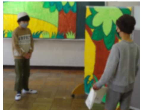
すずめとポーのやりとり