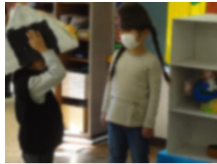
ぼうしを買いに来るお客さんたち