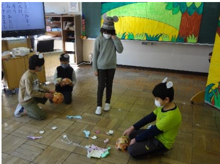
オリジナルのぼうしをつくる こねずみたち