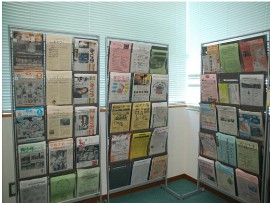
パンフレットラック