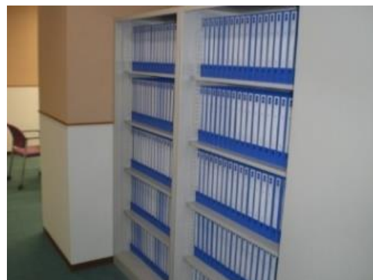
団体情報ファイル