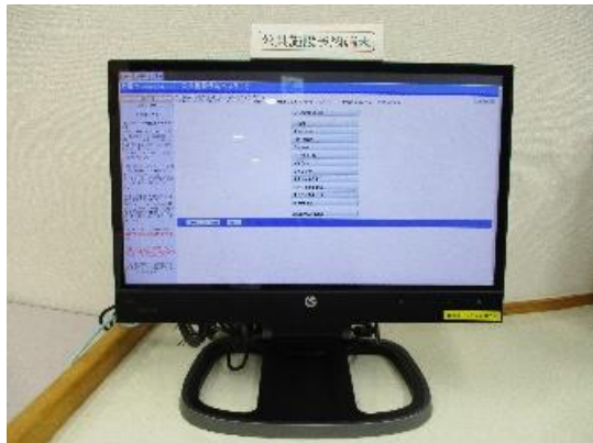
公共施設予約端末