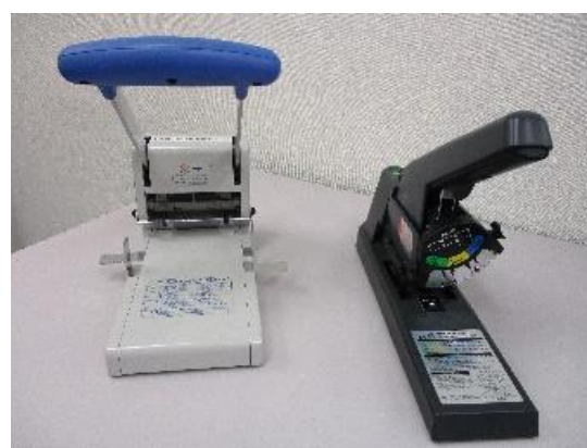
ホッチキス・穴あけ機