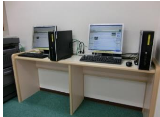
閲覧用パソコン（＝市民開放端末）2台