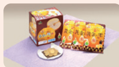
【さいたま農業協同組合】 黄金の栗 ゴミ