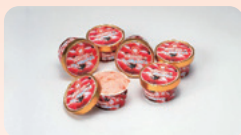
【市ノ川園芸】 甘熟トマトの ヨーグルトアイス