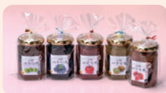
【特定非営利活動法人 グローブ】 四季旬果