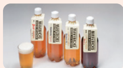
【マーベリックス ピアステーション】 ペットボトル生ビール