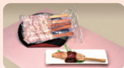
【味衛門】 上尾串ぎょうざ(冷凍)

追加認定した推奨土産品は下記の6点です。新しい上尾のお土産として利用してください。一部商品は、あげお お土産・観光センターでも購入できます。