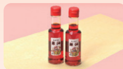
【幸戸李】 幸戸李の辣油