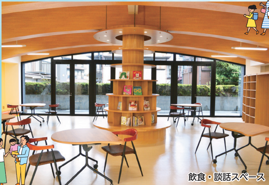
飲食・談話スペース