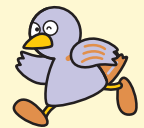
埼玉県マスコット「コバトン」

埼玉県は、スポーツアスリートの競技力向上、スポーツ指導者の指導力向上や県民の体力・健康づくりをサポートすることを目的として、市内にスポーツ科学拠点施設を整備することを検討しています。市民の健康増進、元気にぎわいに満ちた健康長寿社会の実現に向け、県と連携を図っていきます。