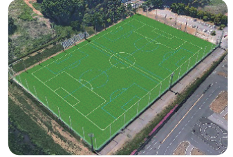
総人工芝・夜間照明完備の平塚サッカー場