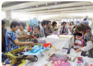
いきいきクラブ女性部の活動

令和2年度末の加入者数は4,931人、60歳以上の加入率は6.6%。この数字は、県内の人口20万人以上市の中では、 第2位 です。