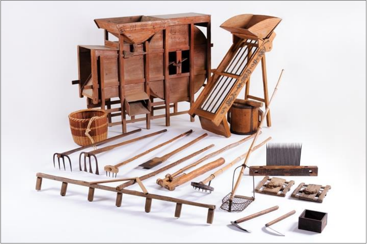
「上尾の摘田・畑作用具」