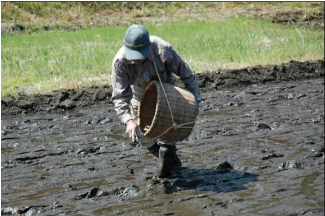
田摘み（播種）の様子（灰と混ぜた稲の種子を摘み、田に直接蒔いている）