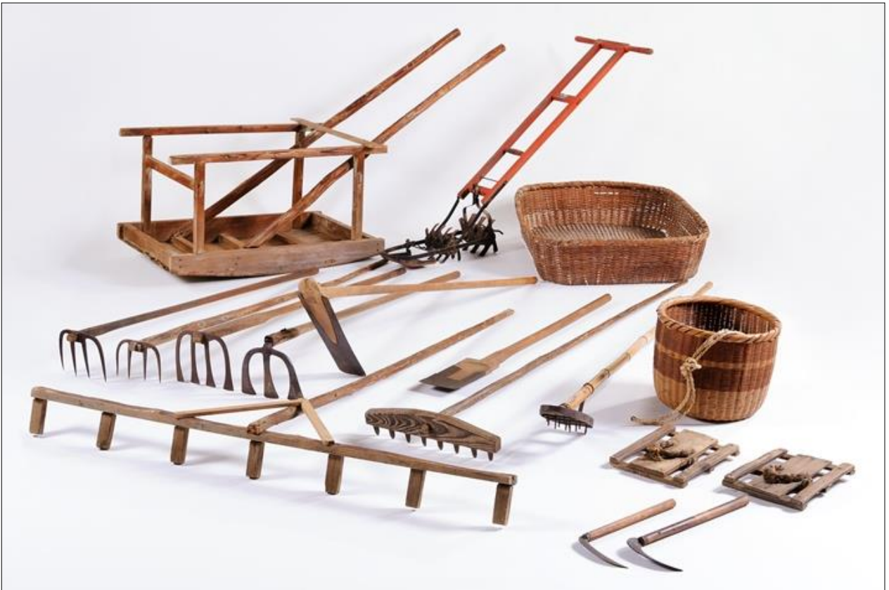
「上尾の摘田・畑作用具」のうち、摘田用具