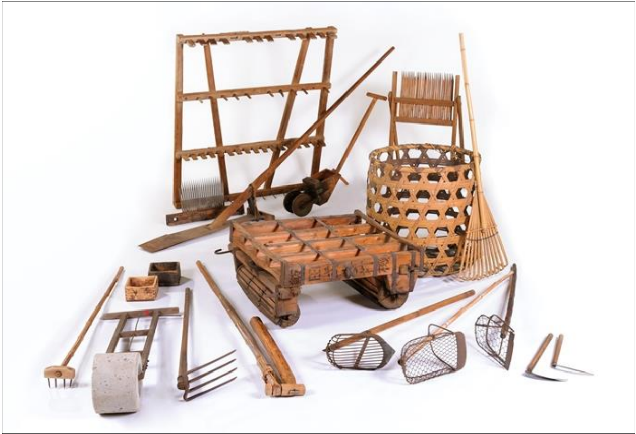
「上尾の摘田・畑作用具」のうち、畑作用具