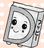
あっぴいぶっくるのキャラクター「アッピー」

子どもの読書活動支援センター 【開館時間】 10:00～16:30 所柏座4-3-8富士見小学校内 ☎・☎773-3711