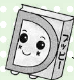
あっぴいぶっくるのキャラクター「アッピー」

子どもの読書活動支援センター 【開館時間】 10:00~16:30 ☎柏座4-3-8富士見小学校内 ☎☎773-3711