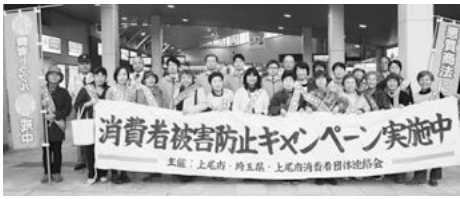
昨年行われた消費者被害防止キャンペーン

5月の消費者月間に合わせ、消費者被害を未然に防止するため、市消費者団体連絡会・市消費者被害防止サポーターの会・県などが協力して、消費者被害防止キャンペーンを実施します。5月22日(水)16時～5月23日(木)16時、JR上尾駅自由通路、東西ペDESTロリアンデッキ、消費者被害防止を呼び掛け、啓発チラシ・消費者被害防止シールなどを配布。消費生活センター☎75-0800・☎776-4600