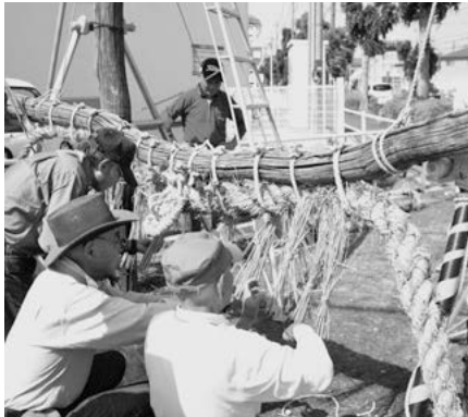
新しい大縄に架け替える「川の大じめ」