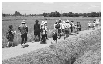
昨年のあげお歴史探検ツアー

上尾の歴史を学びませんか？ きっと上尾がもっと好きになります。普段見ることの少ない文化財と一緒に探してみましょ。 ⑰6月14日(金)9時30分～11時30分 所上尾公民館 ⑱上尾地域周辺の文化財を歩いて巡り、見学する ⑲市内に在住の小学生 ※小学3年生以下は保護者同伴です。 ⑳25人(応募者多数の場合は抽選) ㉑探検バッグ(持っている人)、飲み物、筆記用具 【服装】歩きやすい服装 ㉒6月5日(水)までに住所、氏名(ふりがな)、学校名、学年、電話番号、保護者氏名を直接か電話またはファクス、メールで生涯学習課へ