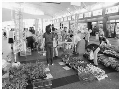
数多くの野菜や花が並ぶ「あげお夕市」