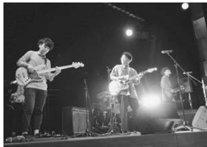
さまざまなジャンルのアーティストが出演