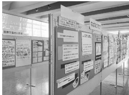
昨年のミニ消費生活展