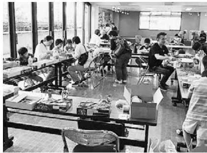
昨年のあげおプラモ展

⑥スケールモデル・キャラクターモデルなどのプラモデル、工具や塗料などの販売 ※購入したプラモデルはその場で制作できます。 ⑦園文化センター ⑧74-2951・74-2955