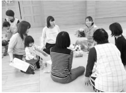
参加者同士で情報交換

流 対上尾市に転入して、子育てをしている保護者と乳幼児 定16組(先着順) 申5月7日(火)13時から電話で子育て支援センターへ 園子育て支援センター 回78-2008・ 77-5804