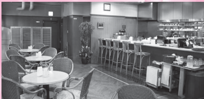
カフェ・ド・グランベル