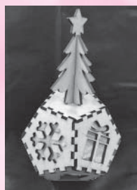
※手作りランタン デザインは異なります。