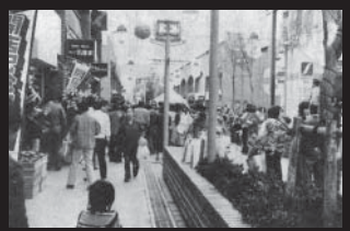
開業間もないモンシェリービル (昭和40年代)

よう！親子での参加も大歓迎です！時3月2日(土)9〜11時(雨天時は、3月9日(土)に延期) 所 市民体育館(鴨川)