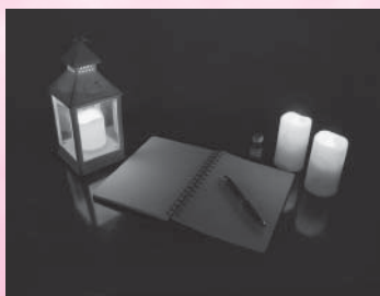
キャンドルナイト (イメージ)

※この事業は、全国モーターボート競走施行者協議会からの拠出金を受けて実施するものです。