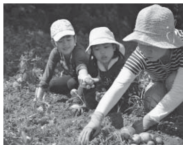
親子でジャガイモを収穫

飲み物、軍手、鎌(持っている人) 【服装】長袖・長ズボン、帽子 ⑩管間 ⑨09-9641-15288