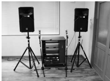
宝くじ助成で整備した集会所備品(音響設備)

業を実施しています。平成30年度宝くじ助成金で、次の物を整備しました。三井区自治会・柳通り北区町内会・日の出町内会/集会所備品(テーブル、イス、音響設備他) ⑩市民協働推進課☎75-4539・☎75-0007