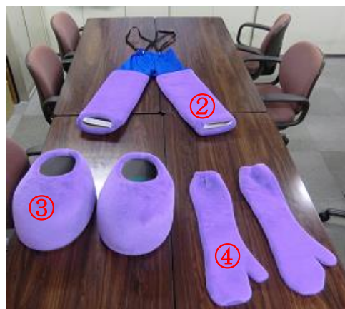
① 本体 ②足（つなぎ） ③足（靴） ④手