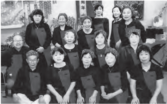
地域に笑顔を増やそうと活動する「サロン青空」の皆さん