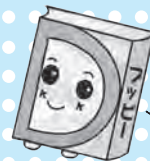
あっぴいぶっくるのキャラクター「ブッピー」

子どもの読書活動支援センター 【開館時間】10:00~16:30 所 柏座4-3-8富士見小学校内 ☎・☎773-3711