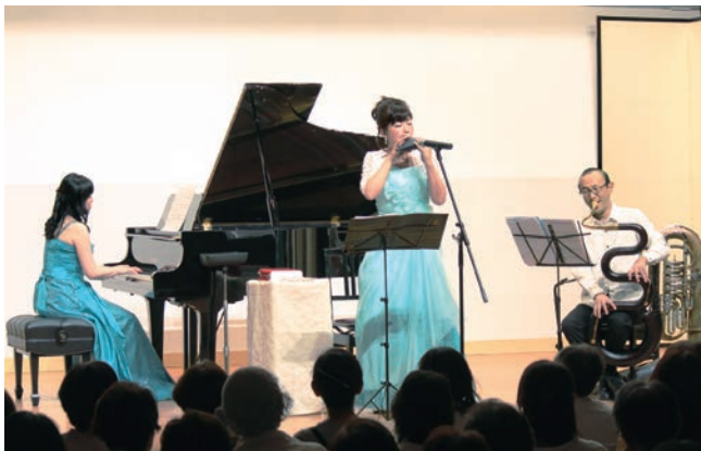
ピアノ、オカリナとフランスの古楽器「セルパン」との三重奏

6月19日、文化センター小ホールで「ジョイフル・クラシック」ピアノとうたう象と小鳥のカーニバルが開催されました。 当日の曲目は「アメイジング・グレイス」「剣の舞」など聞き覚えのあるものや、昔話に由来する懐かしいものなど全13曲。約160人の聴衆は、美しい音色に魅了されました。 中でも、朗読と音楽で表現した氷川御神社に伝わる上尾の昔話「鍛太神宮と3人の童子」は大変素晴らしく、終演後には惜しめない拍手が送られました。