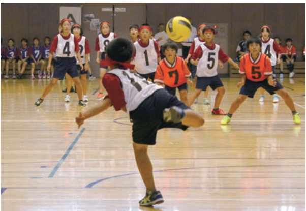
ボールの行方に集中する選手たち

7月3日、上尾市民体育館で「平成28年度小学生ドッジボール大会」が開催され、市内の小学5・6年生で編成された78チーム1,088人が参加しました。 華麗なパス回しからの鋭い投球や、低い姿勢で素早くボールをかわす身のこなしなど、攻守が激しく入れ替わる熱戦の連続に会場は大盛り上がり。選手がボールを当てたりキャッチしたりするたびに、応援する保護者や引率の先生からは大きな声援が飛び交っていました。