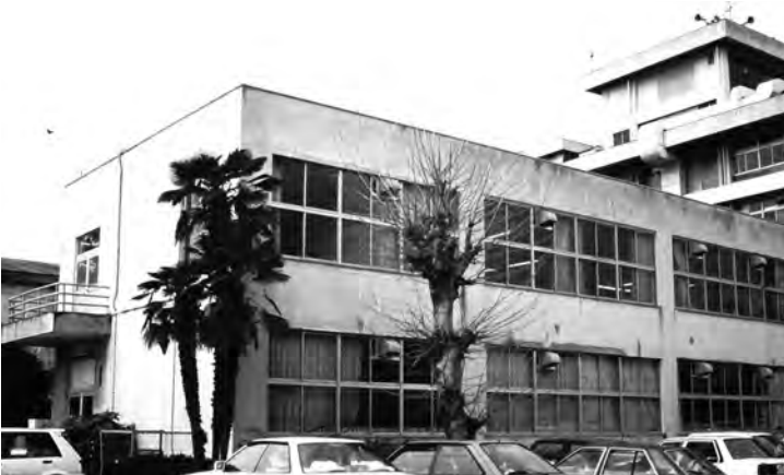
写真2 旧上尾町役場(昭和63年撮影。文化会館時代)