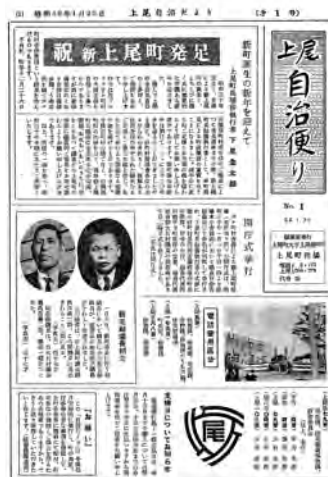
写真1 『上尾自治便り』第1号(現在の「広報あげお」)