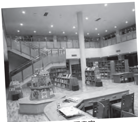
たくさんの本が並ぶ図書室

富士見小学校の図書室には、1万4千39冊の本があります。図書室は2階建てで、吹き抜けになっていて、開放感があります。低学年向けの本や高学年向けの本、お薦めの本などがびっしりと並んでいて、必ず自分に合った本に出合えます。本の世界に入り込んだように感じる、とても落ち着いた場所です。