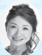
市橋 有里さん 1999年世界選手権セビリヤ大会女子マラソン銀メダル