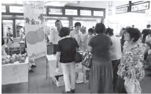
黄金の栗を買い求める人々(昨年のあげお朝市)

朝採りの野菜や卵、草花の販売の他、今月は上尾・伊奈ブランドのナシ「黄金の栗」のPRコーナーを設置します。 ※「黄金の栗」とは、上尾市と伊奈町で生産された日本ナシ「彩玉」のうち、糖度13度以上、重量500g以上のなどの基準を満たしたものです。 ☎8月27日(土)10時～12時30分 ☎JR上尾駅自由通路 岡農政課☎75-7384・☎75-9872