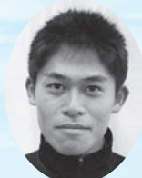
川内 優輝さん 2014年仁川アジア競技大会男子マラソン3位(埼玉県庁)