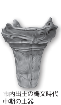
市内出土の縄文時代中期の土器

8月1日(月)～14日(日)に直接か電話またはファクスでコミュニティセンターへ ☑上尾市コミュニティセンター☎775-0896・☎775-0898