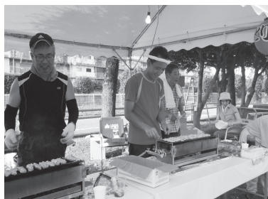
夏祭りで即席焼き鳥職人になる役員の皆さん

自治会は13人の役員で構成され、4月の総会終了直後から、1年で最大のイベントである「夏祭り」に向けての活動が始まります。模擬店やイベント、ポスター作成、食券や食材購入など全て役員で企画・準備を行ってきました。夏祭