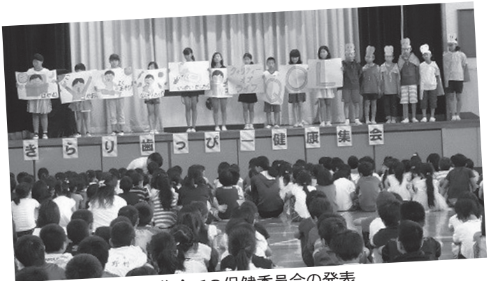
きらり歯っぴー健康集会での保健委員会の発表