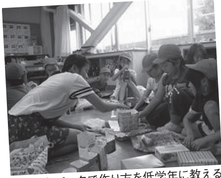
クラフトパークで作り方を低学年に教える6年生

1年生から6年生までの縦割り班で、他の学年の子たちと交流します。一つの班は約13人で、6年生を中心に活動します。「クラフトパーク」という行事では、身近な材料を集めて遊び道具を作り、仲良く一緒に遊びます。段ボールの的当て、新聞紙でのゴルフ遊びなど、材料や作り方を工夫して活動します。この活動を通して、他の学年の子とも仲良くなり、交流が深まっています。