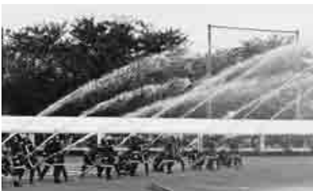
消防団による一斉放水(昨年度)

市民、自主防災会、消防機関や各種ライフライン関係機関などによる災害時応急対策活動の訓練や、防災協定を締結する自治体、民間団体が参加・協力して緊急物資供給訓練などを実施します。皆さんぜひ参加してください。 8月24日(日)8～12時 所 大石北小学校