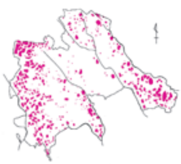
市内の埋蔵文化財包蔵地分布図

どの恒久的な建物、道路その他の工作物を設置するとき③盛土または一時的な工作物の設置により、埋蔵文化財に影響を及ぼす恐れがあるとき