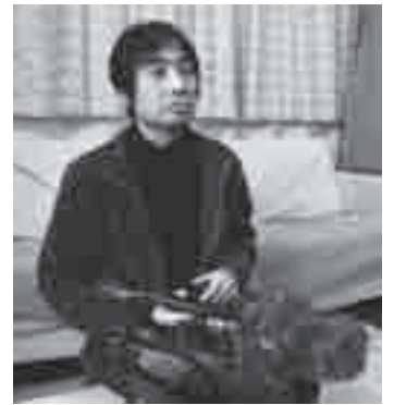
作品に込めた思いを語る

たと語っていました。原市沼の古代蓮は、過去大きな物で直径40センチの白い花が咲きました。全体的に30センチ以上の花が多いのも、他の場所にはない特徴です。ことしも6月20日ごろから8月15日まで、午前5時～午後4時ぐらに見ることが出来ます。見頃は朝の6～9時です。開花時期になったら、ぜひ古代のロマンを見に来てください。