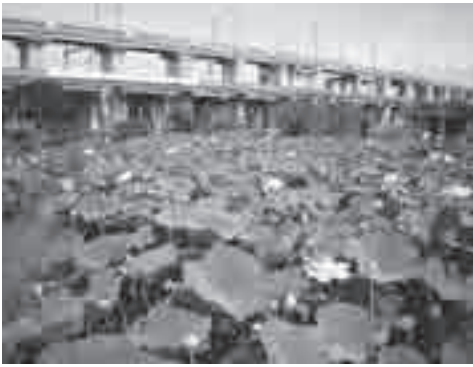
美しい花を咲かせる古代蓮