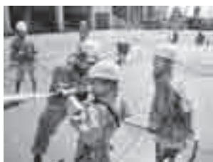
放水体験(昨年の夏休み一日消防士)

▶とき 8月6日(火)・7日(水)のいずれも午前9時～午後4時 ▶ところ 市消防本部・東消防署 ▶内容はしご車に挑戦、消防車出動訓練、放水体験、すぐに役立つ応急処置、地震体験他 ▶対象 市内に在住の小学4～6年生(初めて参加する児童を優先) ▶定員 各35人(応募者多数の場合は抽選) ▶参加費 無料 ▶申し込み 往復はがきに希望日(①6日②7日③どちらでも可)、住所、氏名(ふりがな)、性別、学校名、学年、保護者氏名、電話番号を記入して、7月11日(木)まで(当日消印有効)に消防本部予防課(〒362-0013上尾村537)へ