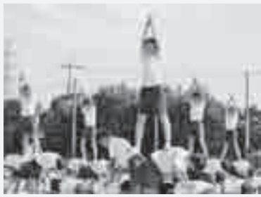
体育祭伝統の2・3年生男子の組み体操

今後も、この「学校自慢ベスト3」をさらに発展させ、よりよい上平中学校をつくっていききたいです。