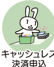
キャッシュレス 決済申込