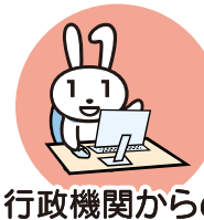
行政機関からの お知らせ・各種証明書