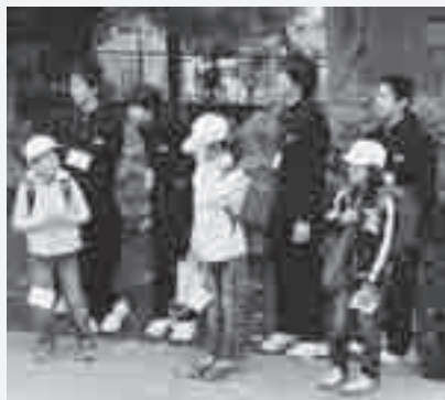
小学校でのあいさつ運動

東日本大震災の復興を願って、私たちにできる活動を行ってまいります。生徒会を中心とするメンバーで昨年7月には東北へボランティアに行きました。テレビの映像では感じ取れない多くの事を体験し、学校に戻ってきて報告会をしました。また作業着に「頑張ろう東北」を刺繍し、東北の人へエールを送りました。そして6月上旬には旧騎西高校の双葉町役場を訪問し、芝人形作り、花壇作りをしました。共に汗を流すことで被災された人に共感することができ、とても貴重な経験になりました。