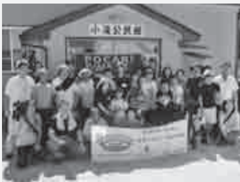
ボランティアで訪れた被災地で

東日本大震災の復興を願って、私たちにできる活動を行ってまいります。生徒会を中心とするメンバーで昨年7月には東北へボランティアに行きました。テレビの映像では感じ取れない多くの事を体験し、学校に戻ってきて報告会をしました。また作業着に「頑張ろう東北」を刺繍し、東北の人へエールを送りました。そして6月上旬には旧騎西高校の双葉町役場を訪問し、芝人形作り、花壇作りをしました。共に汗を流すことで被災された人に共感することができ、とても貴重な経験になりました。