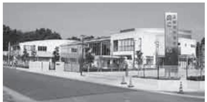
児童館こどもの城