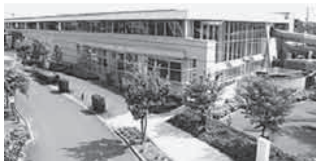
健康プラザわくわくランド

ご利用ください! 市内循環バス「ぐるっとくん」平方循環・東西循環で「わくわくランド」下車