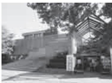
コミュニティセンター

浄水場をこの機会に見学し、水道の大切さを考えてみませんか? ▼とき 6月3日(日)・4日(月)午前10時～午後4時 ▼ところ 北部浄水場(中分3-76、左図参照) ▼内容 職員のご案内による施設見学 申し込み 当日、直接浄水場へ ▽水道部総務課(☎775-5160・FAX775-9041)