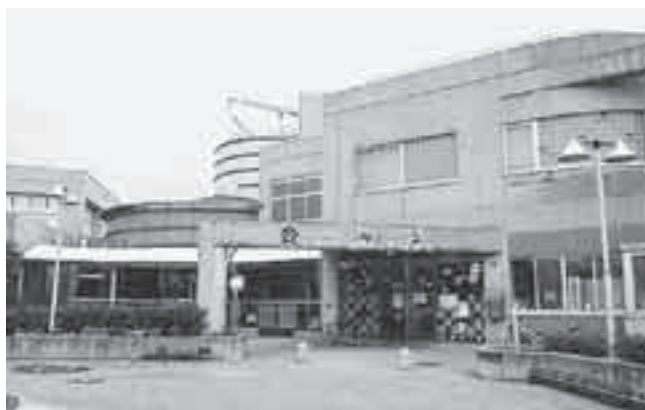
児童館アッピーランド

ご利用ください! 市内循環バス“ぐるっとくん”原市・上平循環で「アッピーランド」下車