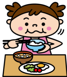
朝ごはんをよくかんで食べる

スマートフォンやゲーム機などの強い光は睡眠に影響します。寝る前に見るのはやめましょう。