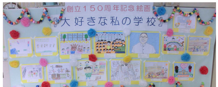
児童の描いた「大好きな私の学校」

前半は市長や教育長からの祝辞をいただいたり、実行委員長から記念品をいただいたりしました。後半は、食事をしながら上平小学校の歴史を振り返り、地域の更なる交流を深めました。