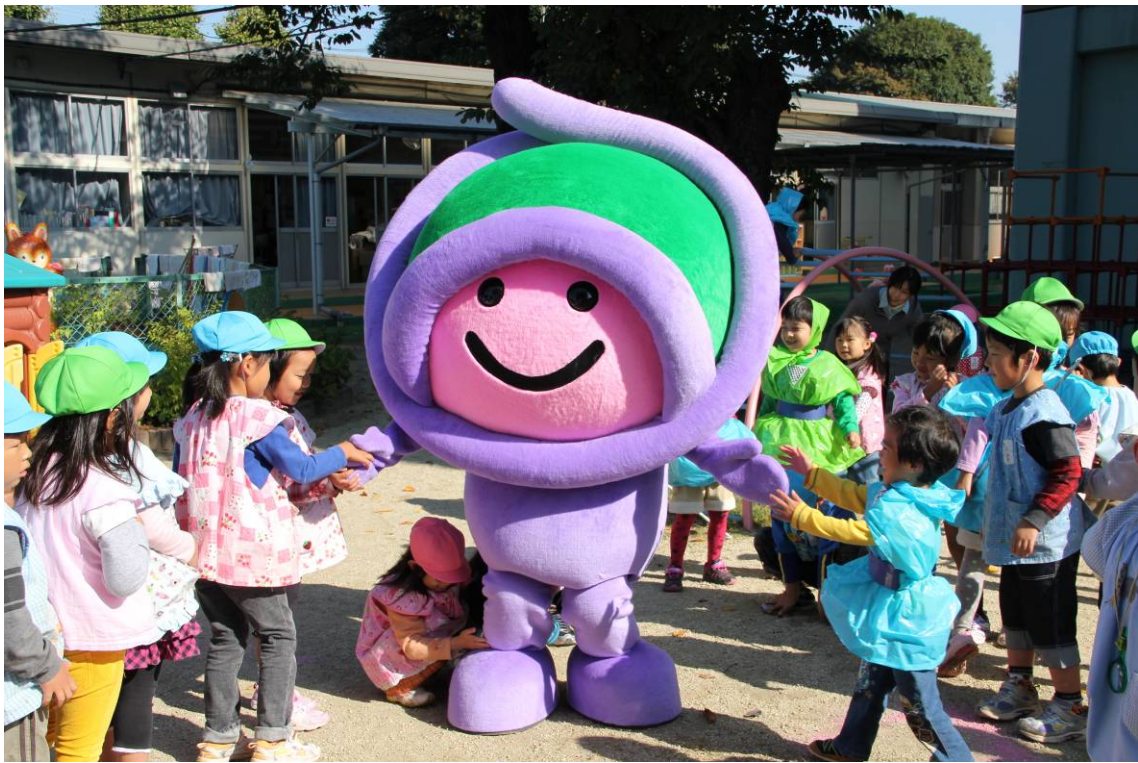
〔アッピーと触れ合う平方幼稚園園児の皆さん〕