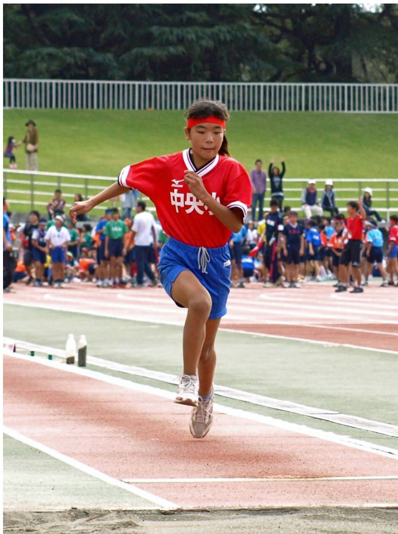
〔上尾市小学校連合運動会〕