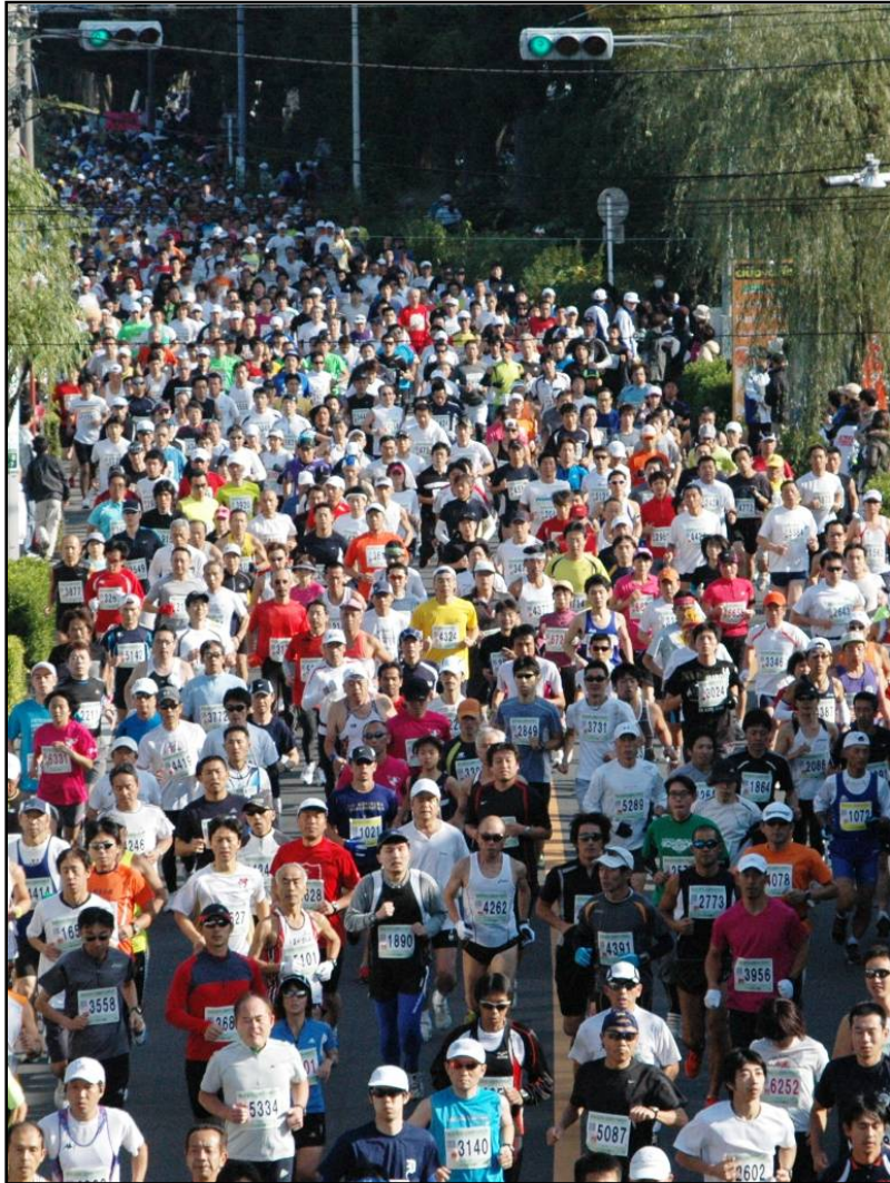
〔上尾シティマラソン〕