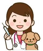
【表2】上尾伊奈獣医師協会に所属する動物病院(五十音順)

動物病院で予防注射を受ける場合は、料金などが異なるので、直接動物病院に問い合わせてください。なお、予防注射と登録・注射済票の交付手続きができる動物病院は、上尾伊奈獣医師協会に所属する動物病院(表2)です。また、注射の猶予を受けた場合は、猶予証明書を生活環境課へ提出してください。