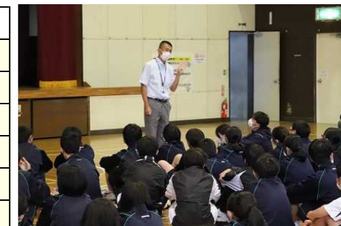
校外学習ガイダンス 11/8