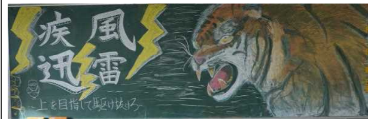
力作ぞろいの黒板アート