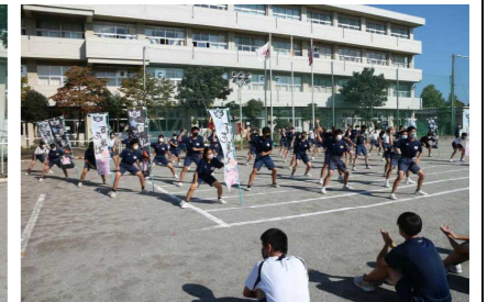
3年生の「ハカ」による応援

○水泳競技は、先日、県大会も実施されました。その結果、平泳ぎで○○さんが二冠を達成しました。おめでとうございます！