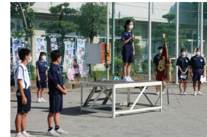
壮行会での決意表明