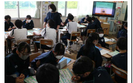
ライフキャリアすごろくの様子

2学期に予定されていた職場体験学習(ツーデイズ・チャレンジ)が、新型コロナウイルス感染症の影響により、今年度も中止となってしまいました。生徒にとって貴重な体験の場が失われることは残念ですが、できることをしっかりやることが大切だと考えます。気持ちを切り換えて、将来を見渡すための学習を進めていきましょう。