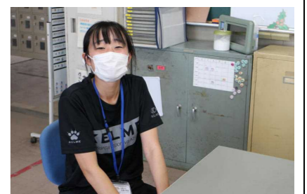
お世話になりました

埼玉大学教育学部4年の○○○○です。9月5日から17日までの2週間、教育実習でお世話になりました。2年生の皆さんは、大きな声であいさつをしてくれたり、笑顔で話しかけてくれたりしました。とても嬉しかったです。また、授業を真剣に取り組んでいる姿を見て、素敵な学年だと思いました。体育祭が終わり、次の目標は新人戦や合唱祭になると思います。それぞれの良さを活かし、目標に向かって頑張ってください。応援しています。