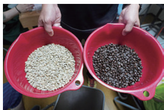
コーヒー豆の焙煎前(左)焙煎後(右)