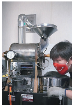
コーヒー豆の焙煎