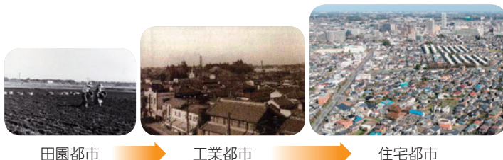
田園都市 → 工業都市 → 住宅都市

今月号は「上尾市の産業」です。45.51平方キロメートルの面積に約23万人(10万5,000世帯)の市民が生活する上尾市。昭和33年の市制施行当時は人口約3万7,000人ほどの田園都市でしたが、高度経済成長期を経て工業都市、そして住宅都市へと変貌を遂げました。成長を続ける上尾市の産業の現在に迫ります!