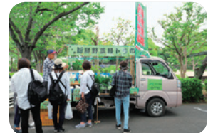
軽トラ・ファーマーズマーケット

市内で生産した新鮮な農産物を農家が直接販売するイベントを各所で開催しています。JR上尾駅前や上尾丸山公園、上平公園などで軽トラックの荷台に新鮮な野菜や季節の花などを並べて販売する、 軽トラ・ファーマーズマーケット や、JR上尾駅自由通路で毎月第4土曜日に開催している あげお朝市 はいつもたくさんの人でにぎわっています。