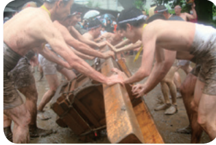
平方のどろいんきょ

市には、ワールドアスレティックス(世界陸連)公認コースで、箱根駅伝の前哨戦にもなっている シティハーフマラソン など、多くの人に参加するイベントが充実しています。また、上尾丸山公園では、春には さくらまつり 、6月には約50種1万株が咲き誇る 花しょうぶ祭り など豊かな自然を満喫できます。さらに、神輿の渡御などで盛り上がる 上尾夏まつり や、地場製品の展示・実演や各種団体の模擬店が充実する あげお産業祭 、白木の神輿を引き回し民家の庭先などで水を掛けて転がす、県指定無形民俗文化財で全国屈指の奇祭「 平方のどろいんきょ 」など見どころが満載です。