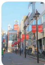
ショーサン通り商店街

商店街を中心に、 地域をつなげて、元気な街づくりを目指す取り組み がされています。