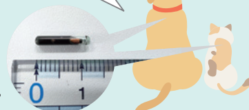
実際の マイクロチップ