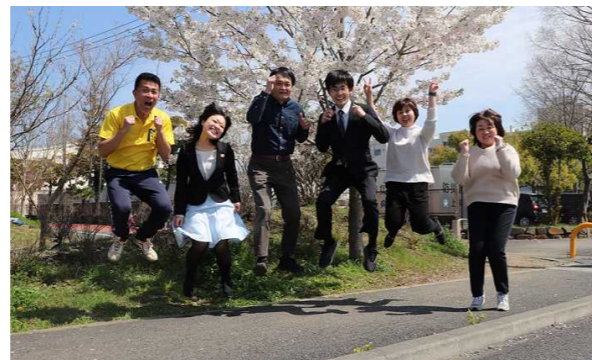
学年職員集合写真 ~よろしくお願いたします~