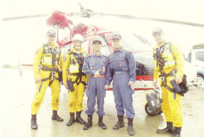
防災航空隊と大倉副団長