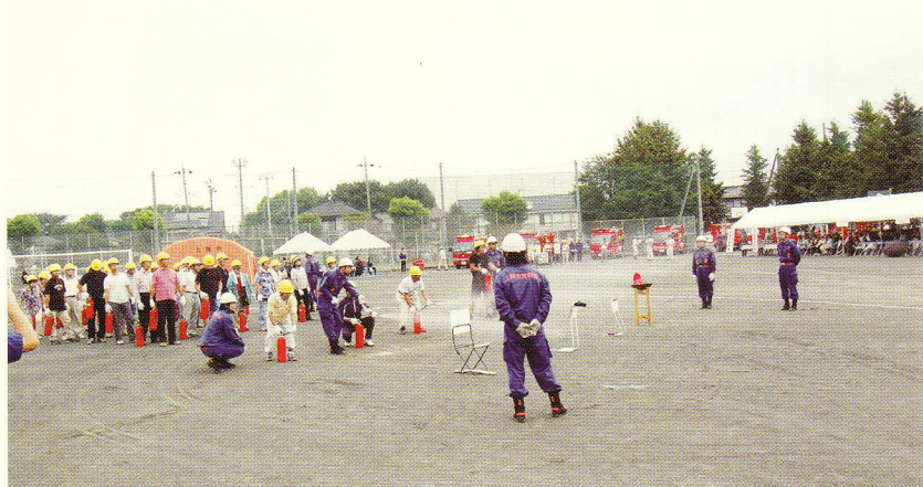
消火器を使った初期消火訓練の市民指導

そして防災訓練を締めくくる「一斉放水」では、参加団員全員が参加し、安全かつ迅速に放水線を揃えることができ、見ていた市民からは大きな拍手が起こり、更なる信頼を得ることができました。