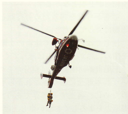
埼玉県防災航空隊