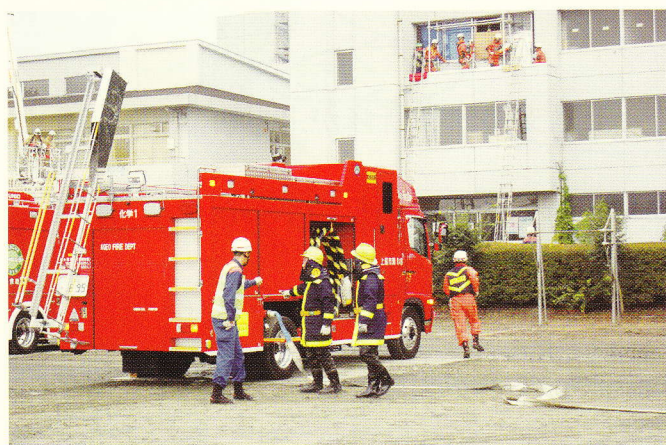
中高層建物火災の後方支援活動