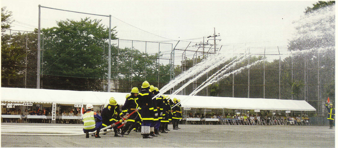
訓練を締めくくる一斉放水