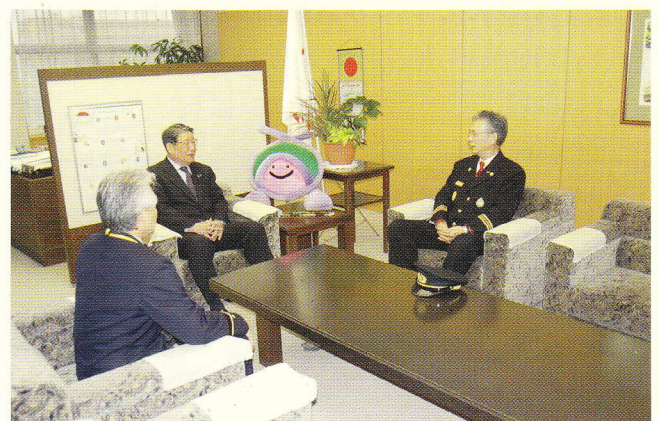
受章を島村市長に報告しました