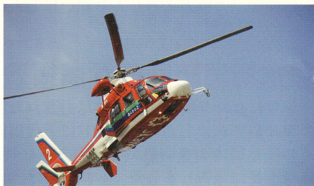
埼玉県消防防災航空隊も参加しました