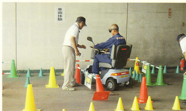
飲酒運転模擬体験