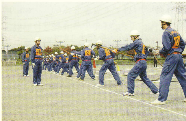
ポンプ車操法の様子