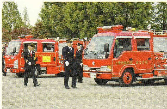
車両・機械器具の点検