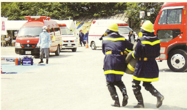
中高層建物火災の後方支援活動(傷病者搬送)

消防団は「消火器を使った初期消火訓練の市民指導」「中高層建物火災の後方支援活動」そして防災訓練を締めくくる「一斉放水」に参加しました。台風の接近が心配されましたが、当日は天候に恵まれ数多くの市民参加のもと参加団員全員が真剣に訓練に取り組み、市民からの更なる信頼を得ることができました。