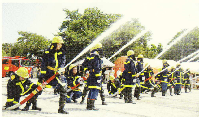
きれいに揃った一斉放水