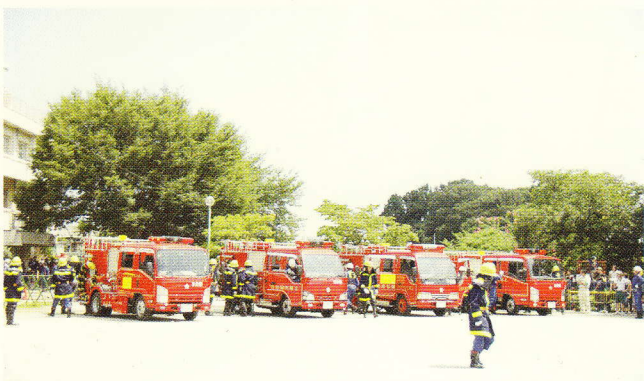
放水準備の消防団車両