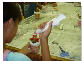
〔夏休みデコスイーツ教室〕