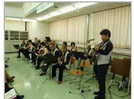
〔みどりのコンサート〕