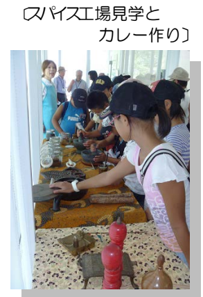
〔パイプ工場見学とカレー作り〕