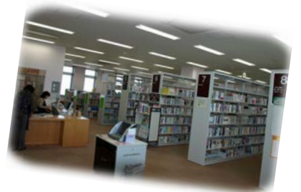
〔たちばな分館館内〕