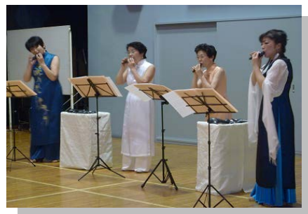
〔オカリナライブコンサート〕