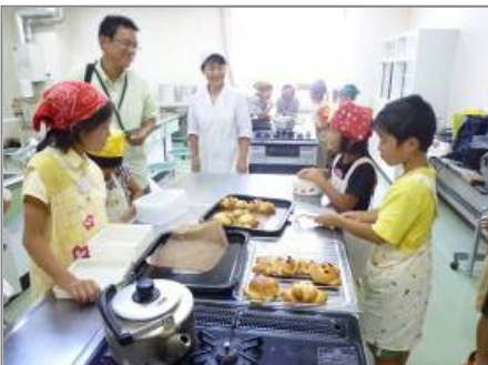
〔夏休み子どもパン作り教室〕