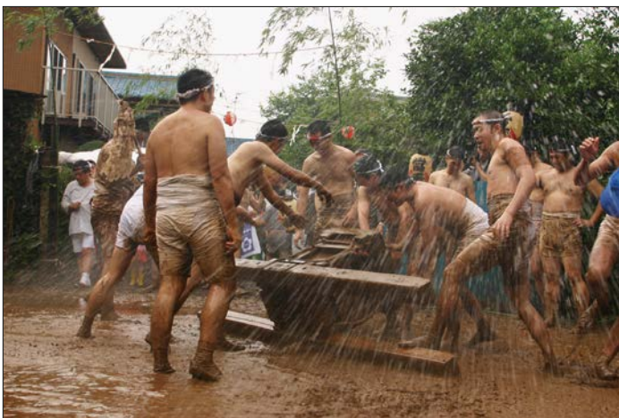
〔平方のどろいんきょ〕