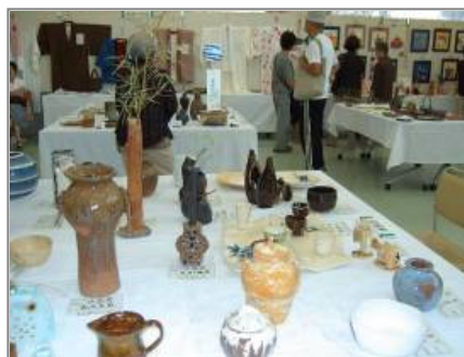
〔大石公民館まつり〕