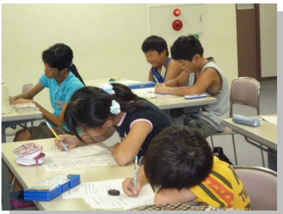
〔夏休み子どもマンガ教室〕