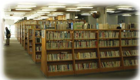
〔図書館本館の館内〕