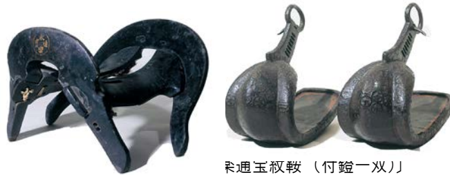
永楽通宝紋鞍 (付鐙一双)