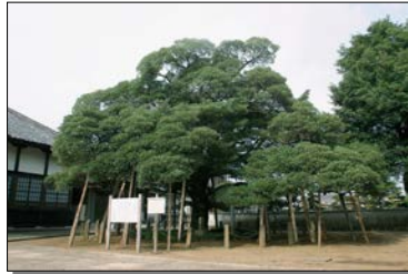
〔馬蹄寺のモクコク〕