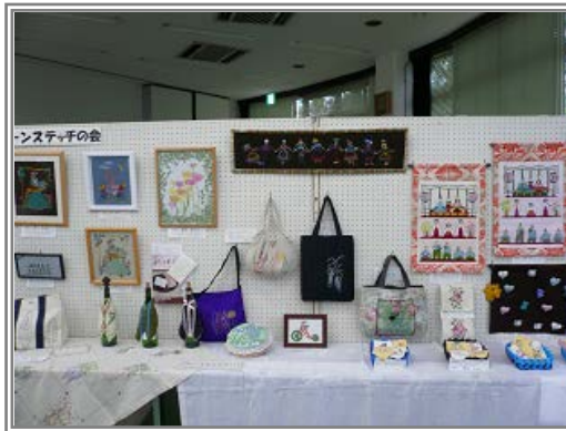
〔上平公民館まつり〕