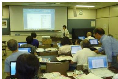
〔シニアのための初心者 パソコン教室〕