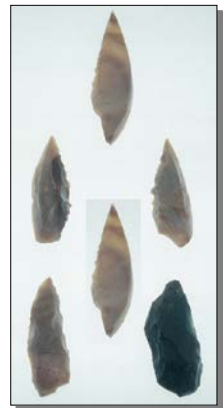
〔殿山遺跡出土旧石器〕