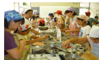
〔夏休み親子料理教室〕