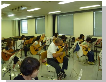
〔初心者フォークギター教室〕