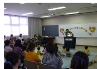
〔夏休み子ども紙芝居〕