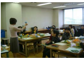
〔幸せを招く アートフラワー教室〕