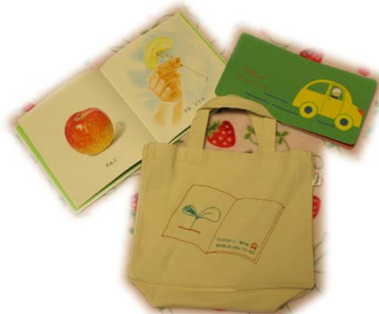
〔ブックスタートの絵本とバック〕