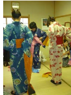
〔ゆかた着付け教室〕