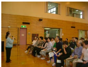
〔大谷いきいき学級 (みんなで歌おう)〕