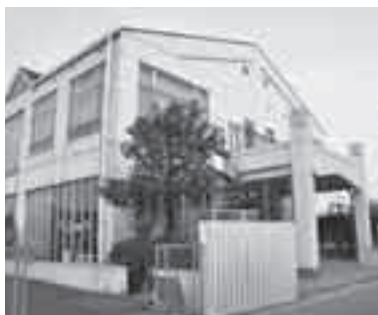
乳幼児相談センター

30日(木)～10月5日(火) ▼ 場外発売 9月6日(月)、7 日(火)、28日(火)、29日(水) ▼ところ ボートレース戸田 ↓県都市競艇組合(☎82 3-8711・☎8233-87 09) 初めての子育て教室 ～親子で楽しく遊ぼう～ ▼とき 10月5日(火)午後1 時30分～2時30分 ▼ところ 乳幼児相談センター ▼内容 親子の遊び・子育て相談など ▼対象 1歳6カ月～1歳11 カ月の幼児と保護者 ▼定員 20組(先着順) ▼申し込み 電話かファクスまたはメー ルで、保護者と子どもの氏名・ 生年月日、地区名、電話番号 を乳幼児相談センターへ ↓乳幼児相談センター (☎)776-6199・☎77 9-0077・☎5172500 @city.ageo.lg.jp)