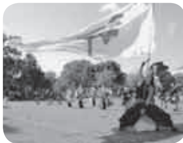
昨年のあげお元気祭り