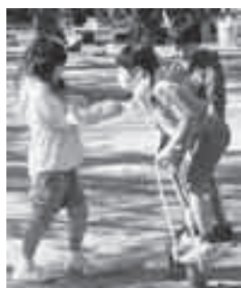
昨年の上尾子どもまつり