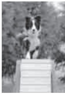
アジリティショー

て飼い主(中学生以上)が2人以上参加できる③参加する飼い主のうち1人が犬法律教室と動物由来感染症教室の両方を受講できる(もう1人は犬のしつけ方教室に参加) ▼定員各40組(応募者多数の場合は抽選) ▼参加費 1組500円(保険料など) ▼申し込み 9月24日(金)までに直接生活環境課(市役所4階)へ ※こゝとは、迷っても身元がすぐに確認できるマイクチップ無料装着券を参加者に差し上げます。 ※当日はアジリティショー(訓練された犬の競技)、ふれあい広場、犬の譲渡会なども開催します。 ↓生活環境課(☎775-9400・☎775-9927)