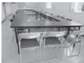
宝くじ助成で購入した机といす