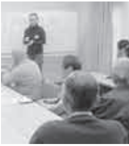
AGA サロン (モンゴルの話)

▼とき 9月19日(日)午後1時30分～4時30分 ▼ところ 上尾公民館501 ▼参加費 会員/200円、非会員/400円 ▼申し込み 毎週月・木・金曜日午前10時～午後4時に直接か電話またはメールで、市国際交流協会(AGA)へ ※予約なしでも参加できます。 ↓AGA事務局(市役所第3別館1階、☎78002468・☎77509819・office@aga-world.com)