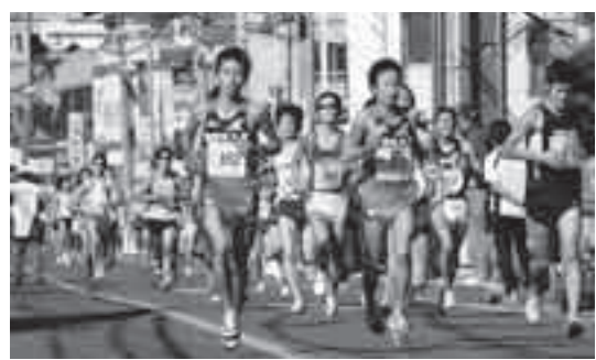
ことしはあなたもランナー!(昨年のシティマラソン)

●ランニング教室 ↓上尾シティマラソンに向けて ▼とき 10月6日〜27日の毎週水曜日(全4回) 午前10時〜11時30分 ▼ところ 市民球場会議室と多目的広場 ▼対象 初級者 ▼定員 30人(先着順) ▼参加費 500円 ▼申し込み 9月1日(水)〜22日(水) 午前8時30分〜午後5時に直接市民球場へ