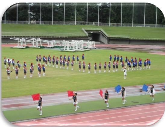
上尾市民体育祭 上尾シティマラソン