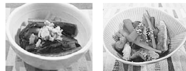
レシピで作れる料理の例

市産業振興会議では、「地産地消」の推進に向けた取り組みの一つとして、地元農家や市民団体の皆さんに協力していただき、地元農産物を使った料理や郷土料理のレシピをまとめました。レシピについては、農商工観ポータルサイト「あげポタ」(☎http://agepota.jp/)で公開している他、あげお朝市・夕市や市農産物直売所で配布していますので、ぜひ活用してください。