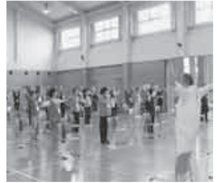
生き生きと体操する高齢者

人で、平成22年度には、新たに6カ所の会場で開催が予定されているとのこと。県内でも、トップクラスの介護予防体操の普及状況で、上尾市民が誇ることができる「アツピー元気体操」です。これからも市民みんなで健康づくりを進め、アツピー元気体操で一人でも多くの元気な高齢者が上尾に増えることを願うものです。