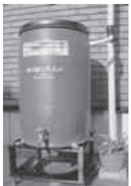
タンクの設置例。バルコニーに置いてガーデニングに利用することもできます。