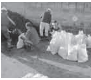
荒川緑肥の袋詰め

市民一人一人が防火意識を高め火災の発生を防ぐことを目的に行うものです。期間中は横断幕を市内各所に設置し、消防車で火災予防広報を行います。 ※生命・財産を守るため住宅用火災警報器を設置して、火災に備えてください。 ↓消防本部予防課(☎775-314・☎775-2230) 荒川緑肥を無料で配布 荒川上流河川事務所では、荒川堤防で刈り取った草から作った堆肥(荒川緑肥)を無料で配布します。 ▼申し込み 往復はがきに住所、氏名、電話番号、受取ヤード名、希望緑肥量(kg)、希望受取日(午前か午後を指定、第3希望まで記入可)、意見を記入して、12月20日(月)まで(当日消印有効)に荒川上流