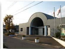
平方公民館 (A-5) TEL 048-726-3446