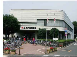
図書館本館 (D-3) TEL 048-773-8521