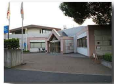
原市公民館 (F-5) TEL 048-721-4948