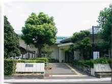
上平公民館 (D-2) TEL 048-775-9308