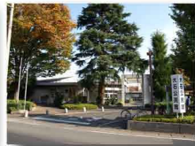
大石公民館 (B-3) TEL 048-726-6615