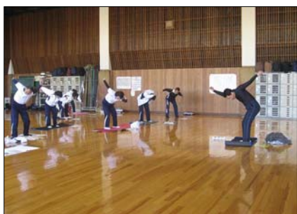
〔体育指導委員研修会〕