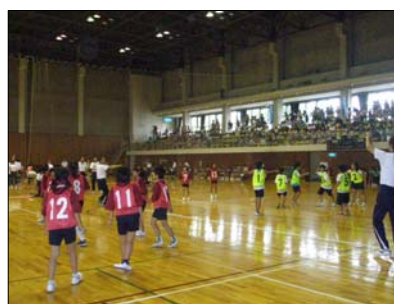
〔小学生ドッジボール大会〕