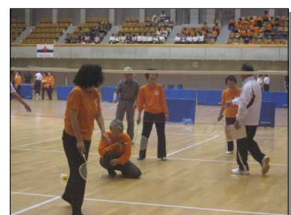
〔県スポーツフェスティバルへの協力〕