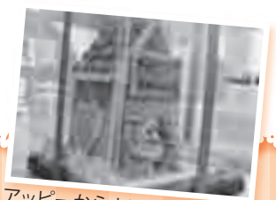
アッピーからホワイトデーにクッキーの家のお返し