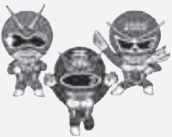
西中のマスコットキャラクター 西中戦隊「マモルンジャー」

学校総合体育大会やその他の大会で多くの生徒が好成績を残し、県大会に出場しました。美術展で入賞する生徒もたくさんいます。西中はあらゆる面で活躍し、頑張っています。これらの「誇り」を大切に守り継承していきたいと思いい、日々活動しています。