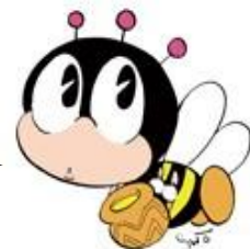
生涯学習のマスコット “マナビイ”

“子ども大学あげお・いな・おけがわ”とは、 地域の大学や自治体等が連携し、 子どもの知的好奇心を刺激するさまざまな講義や 体験活動を行う“子どものための大学”です。