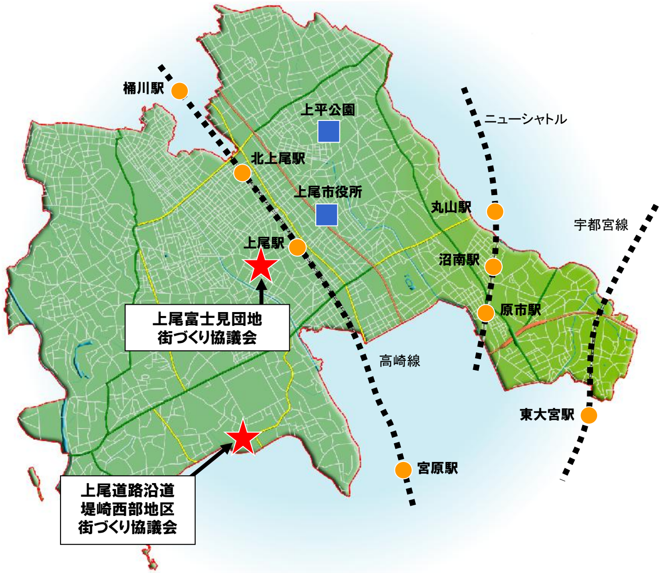
街づくり協議会 位置図