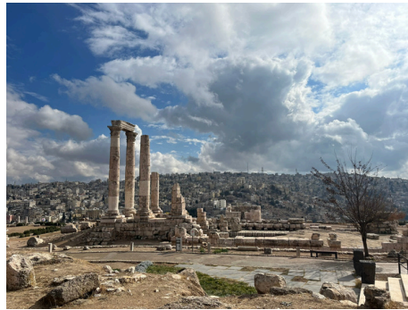
首都アンマンにあるローマ遺跡