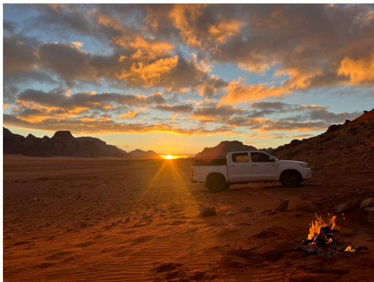
世界遺産、ワディラム砂漠で見た2025年の初日の出

そういえば、以前タクシーの運転手さんと話していた時、私がJICAの協力隊員として活動していることを話すと、「俺の家族が前にJICAと一緒に働いていたんだ!」と教えてくれたことがありました。そのタクシーに乗っている間、終始明るく話しかけてくれ、最後には記念に私の名前をアラビア語で書いて渡してくれました。このように「日本人と会ったことがあるから、その時の印象がとてもよかったから」という理由で、見ず知らずの私たちにまで温かく接してくれる人がたくさんいました。この信頼は一朝一夕にできるものではなく、先人たちの積み重ねがあってこそだと実感した出来事でした。帰国まで残りわずかですが、そのことを胸に刻んで、残りの任期を全うしたいと思います。