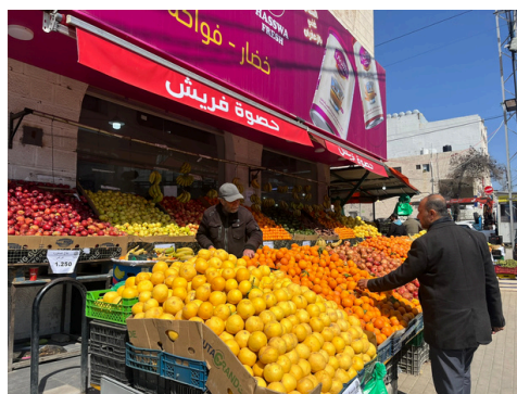
左：近所の八百屋さん 右：お肉屋さん

また、ヨルダンでは新鮮な野菜や果物を日本より安く買うことができます。1kg単位で値段がついており、トマトは1kg=約70円、オレンジは1kg=約150円です。