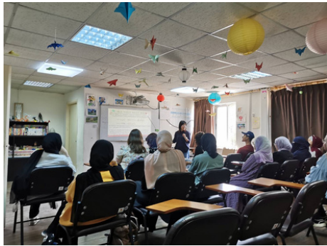
大学で授業をしているところ

私は2023年10月から2025年10月まで、JICA海外協力隊としてヨルダンで活動しています。首都アンマンにあるヨルダン大学に所属し、日本語の授業をしたり、イベントをしたりしてきました。日本語は学科ではないものの、アニメや日本文化に興味を持つ学生が数十名いて、楽しく日本語を学んでいます。そのほかにも、日本語を学ぶ人々を対象にした会話クラブや、日本語弁論大会を開催したりしました。今日は、私が住んでいるヨルダンについて少しご紹介します。