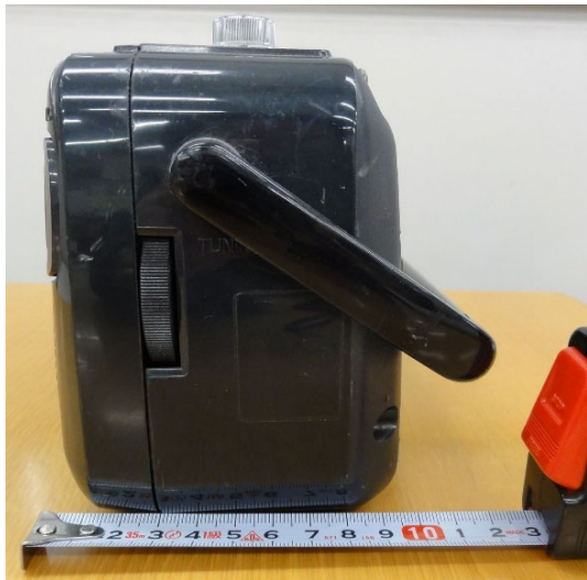
③側面 (右) 奥行10cm、持ち手を下げると13cm