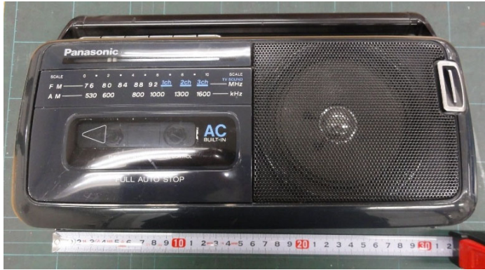
①前面 パナソニックRX-M50 横幅30cm