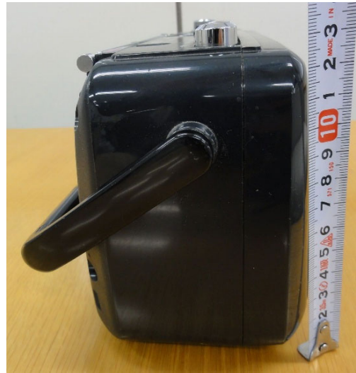
④側面 (左) 高さ13.5cm