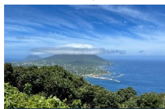
登龍峠から底土港を望む

「海・山・暮らし館」は、「あさぬま商店」から150mほどのところにあり、「学校かな？」と思って横を通りましたから、よく記憶しています。負傷者はなかったようですが、被害の様子は、映像でも流れましたので、ご存じの方も多いと思います。他にも、暴風による家屋の損壊、倒木や土砂による道路の寸断、停電や断水など多くの被害が発生しました。停電や断水は、現在はほぼ解消されたようですが、八丈一周道路は、三根から末吉に向かう登龍（のぼりょう）道路が、いまだに閉鎖の状態です。島特産のあしたば加工場や、しいたけの栽培ハウス、ホテルやラーメン店など建物の損壊は、まだ復旧できていないものが多いようです。